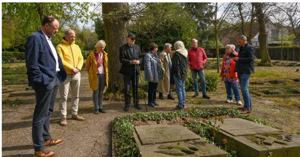
Besuch des Friedhofs in Kaiserswerth

Am ersten Tag lernte die Gruppe in einer Führung die bewegte Geschichte der 1836 gegründeten Kaiserswerther Diakonie kennen – und deren heutige Bedeutung. Sie gehört zu den grossen diakonischen Sozial- und Gesundheitsunternehmen in Deutschland und beschäftigt heute rund 2'800 Mitarbeitende.